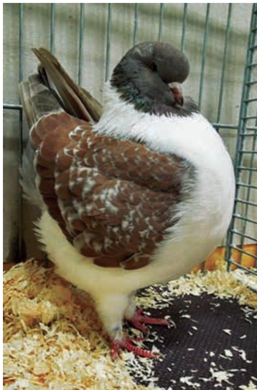
Gazzi, bruinzilver bronsgeband.

Van oorsprong is de Modena een Italiaanse vliegduif uit de 17 e en 18 e eeuw. Ze zijn later in Engeland terechtgekomen. In de 19 e eeuw hebben de Engelsen het ras verder ontwikkeld. Al in 1910 werd in Engeland de National Modenaclub opgericht. Deze club vierde in 2010 haar 100-jarig bestaan met een grote jubileumshow met ook belangstelling uit andere Europese landen en uit Amerika. Zelf viel mij de eer te beurt daar te mogen keuren. Na 1910 kwamen er langzaam aan al Modena's naar Nederland en Frankrijk. Hierdoor werd Nederland één van de eerste continentale Europese landen waar een zelfstandige Modenaclub opgericht werd. Dit gebeurde in 1937. Ongeveer in dezelfde tijd werd ook in Frankrijk al een Modenaclub opgericht.