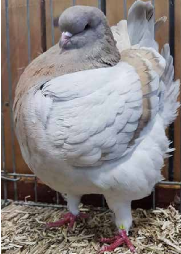
Schietti, khakizilver sulfergebond.